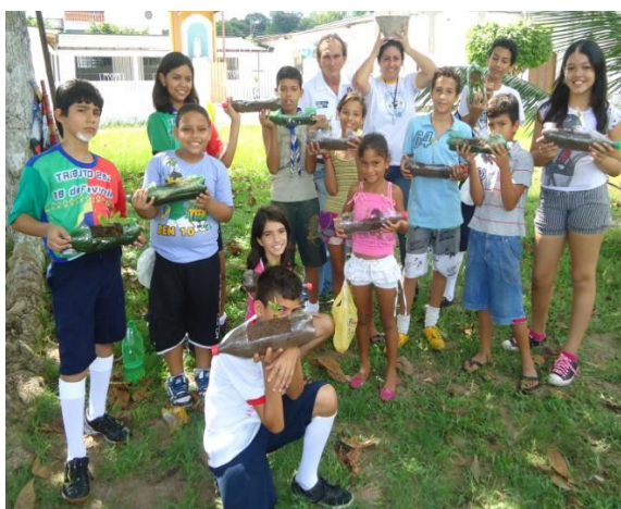
FIGURA 3 – Plantio em garrafas PET do 20º./PA GE Almirante Braz de Aguiar durante o XX MutEco

Outra técnica que segue os conceitos da permacultura é a composteira doméstica, que pode ser feita com três caixas de plástico grandes.