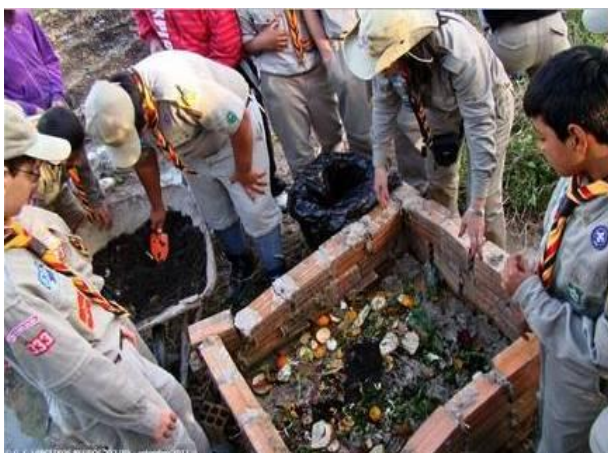
FIGURA 4 – Composteira tradicional do 333º./RS GE Lanceiros Negros no XIII MutCom