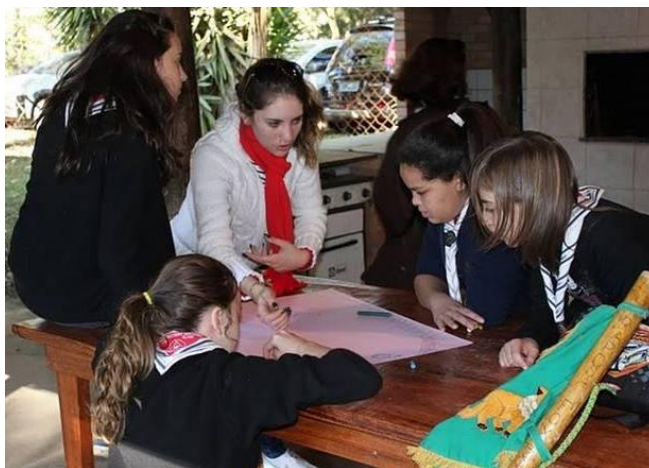
FIGURA 8 – Escoteiras do 52º./SC GE Desterro realizando atividades da IMMA sobre a água durante o XX MutEco

A Parte B, ou seja, “FAZER ALGO”, permite ao membro juvenil identificar os problemas locais da sua comunidade e compreender a ligação entre os níveis local e global. Ele deverá planejar e implementar um projeto, que deverá ser monitorado, avaliado e melhorado através de ações futuras.