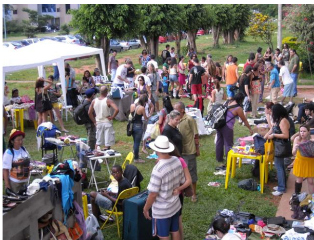
FIGURA 6 – Feira de escambo realizada na UnB em 2010