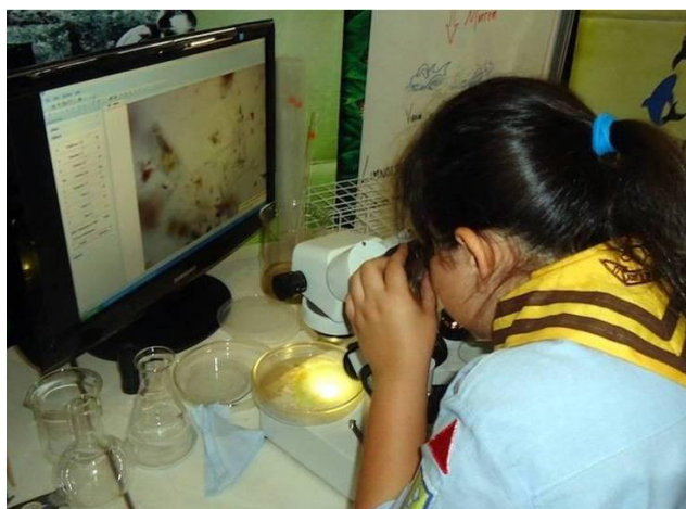
FIGURA 5 – Lobinha do 11º./DF GE José de Anchieta observa amostras de água em exposição durante o XX MutEco

Dois organismos internacionais, a Federação de Ambientes Aquáticos (WEF) e a Associação Internacional da Água (IWA) criaram o Dia Mundial de Monitoramento da Água (WWMD), que é comemorado em 18 de setembro. As pessoas ou grupos interessados podem se cadastrar no site http://www.worldwatermonitoringday.org/ para receber gratuitamente kits de fácil manuseio para o monitoramento da qualidade da água de algum córrego, rio ou corpo d'água próximo. Os kits contêm os materiais necessários para 50 testes de pH, oxigênio dissolvido, temperatura e turbidez da água. Depois de obtidos, você coloca os resultados no banco de dados no mesmo site, contribuindo para conhecermos a qualidade das águas de nossa localidade e de todo o mundo. O custo dos kits, segundo a página do WWMD, é U$ 13,00 mais despesas de postagem.