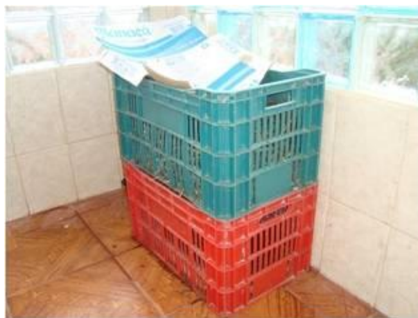
FIGURA 5 – Composteira de Flávia Viana do 52º./MG GE Duque de Caxias