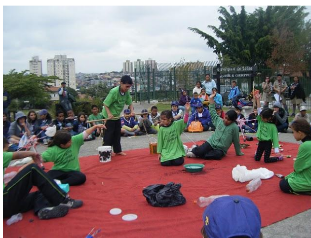
FIGURA 1 – Grupos Escoteiros 30º./SP Tuidara, 297º/SP Órion e 270º./SP Domingos Tonini em atividades teatrais desenvolvidas pela comunidade local

Se você quiser uma fonte de inspiração, assista a Dança da Chuva Escoteira do 13º./DF GE Ave Branca em http://chuvaescoteira.blogspot.com/