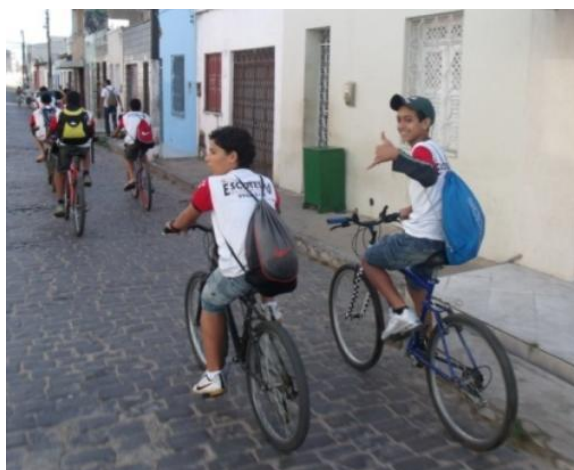
FIGURA 2 – Passeio ciclístico do 14º./SE GE Silvio Romero durante o XX MutEco

Que tal organizar um passeio ciclístico com seu Grupo Escoteiro ? Mas aproveite a ocasião para divulgar na sua comunidade a necessidade de construir ciclovias na sua cidade, que ajudem no deslocamento das pessoas para o trabalho, onde isto for possível.